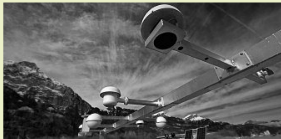
Die Geräte der vollautomatischen Altdorfer Messstation in der Nähe der ARA.

Heute läuft in Altdorf alles vollautomatisch. Die Anlage gehört zu den modernsten überhaupt. Laufend zeichnet sie mit empfindlichen Geräten den Zustand der Atmosphäre auf. Dabei geht es nicht alleine um die Windgeschwindigkeit. Auch die Parameter wie Temperatur, Luftfeuchtigkeit und Niederschlag werden gemessen. Die Messungen werden direkt in die Computer von MeteoSchweiz eingespeist. «Diese Daten erlauben es unseren Mitarbeitern, die Wetterprognosen zu erstellen», sagt Stephan Bader, Klimatologe bei MeteoSchweiz.