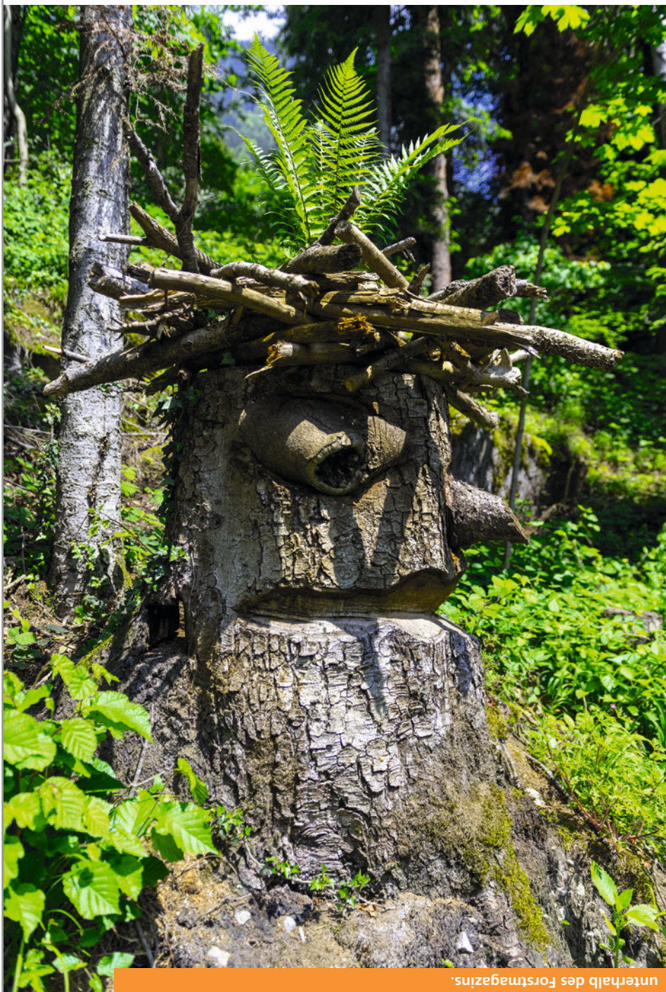
Auflösung dieses Rätsels: Am Waldrand an der Vogelsangasse, gleich unterhalb des Forstmagazins.

Er steht mitten im Wald und wacht über Altdorf. Ist es der Kopf eines Riesen? Eine Sagengestalt oder die Fantasie eines geübten Schnitzers oder einer Schnitzerin? Auf welchem beliebten Spazierweg steht diese Holzskulptur?