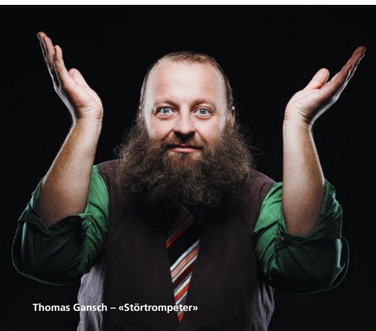
Thomas Gansch – «Störtrompeter»

Auch die 13. Ausgabe des Festivals rückt die alpine Musik und Kultur ins Zentrum. Überraschungen und Entdeckungen gehören zu Alpentöne wie Gipfel zu Bergen. Zu den 50 Konzerten gesellen sich dieses Jahr Sprachbeiträge, ein Kinderprogramm, sechs Alpenfilme, eine begehbare Klang- und eine Fahneninstallation. Zum Abschluss der vier Festivaltage präsentieren sich am Sonntag um 13.30 Uhr rund 20 Ensembles in der freien Natur am Klangspaziergang durch das Naturschutzgebiet des Reussdeltas.