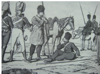
Russische Truppen 1799

Kannst du dir auch Gründe für diese Veränderungen vorstellen?