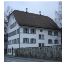
Haus Müller Eingangstür: