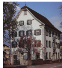
Haus Eselmätteli Eingangstür: