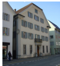
Haus von Roll Eingangstür: