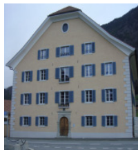
Haus Bessler Eingangstür:

Suche in Altdorf die vier abgebildeten Herrenhäuser und ordne ihnen die entsprechenden prächtigen Eingangstüren zu.