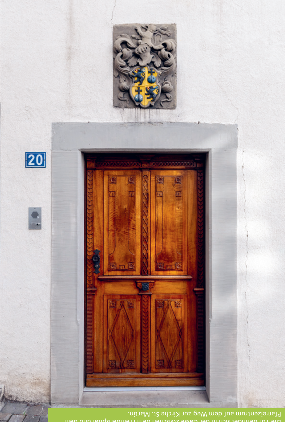
Auflösung dieses Rätsels: Die Tür befindet sich in der Gasse zwischen dem Fremdenspital und dem Pfarrzentrum auf dem Weg zur Kirche St. Martin.

Die schicke Tür lässt Spazierende oft innehalten. Die Schnitzereien, der Türgriff und das Wappen sind wunderschön gearbeitet. Wo in Altdorf ist diese Tür zu entdecken?