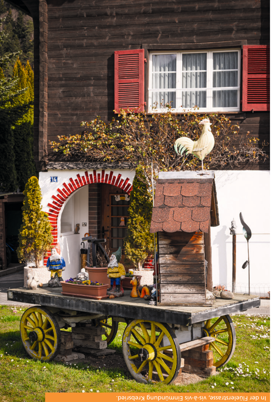
Auflösung dieses Rätsels: In der Flüelerstrasse, vis-à-vis Einmündung Krebsried.

Dieses Arrangement in einem Vorgarten in Altdorf wurde mit viel Liebe zusammengestellt. Beim Vorbeilaufen bleibt der Blick unweigerlich am pittoresken Holzwagen und dem stolzen Hahn hängen. Wo befindet sich dieses kleine Idyll?